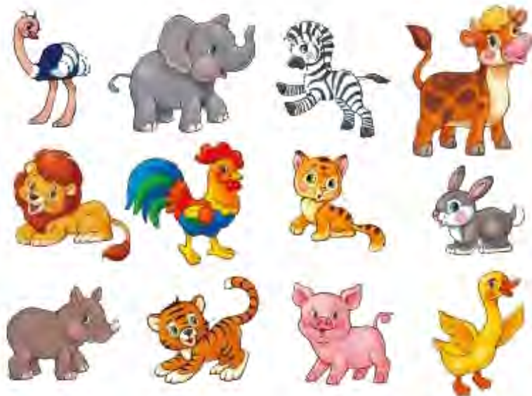
Рис.2. Картинка для запоминания животных.

2. Внимательно рассматривайте картинку в течение минуты. А теперь воспроизведите в алфавитном порядке названия животных, которых вы увидели на картинке (Рис.2).